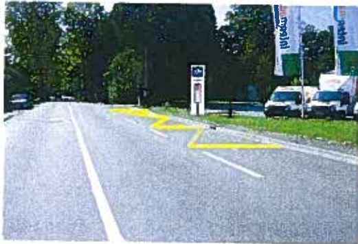
Sens Agen - Nérac : arrêt sur l'encoche existante

Remplacement du poteau existant. Marquage au sol de l'aire d'arrêt.