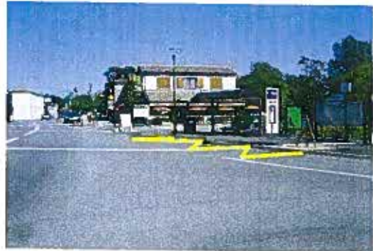
Sens Nérac - Agen : arrêt en ligne devant l'abribus

Remplacement du poteau existant. Marquage au sol de l'aire d'arrêt.