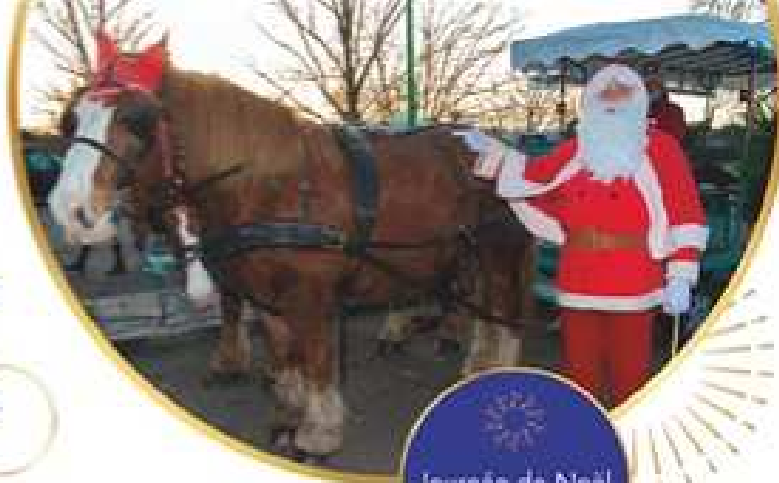
Journée de Noël le 12 décembre