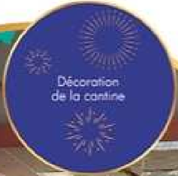
Décoration de la cantine