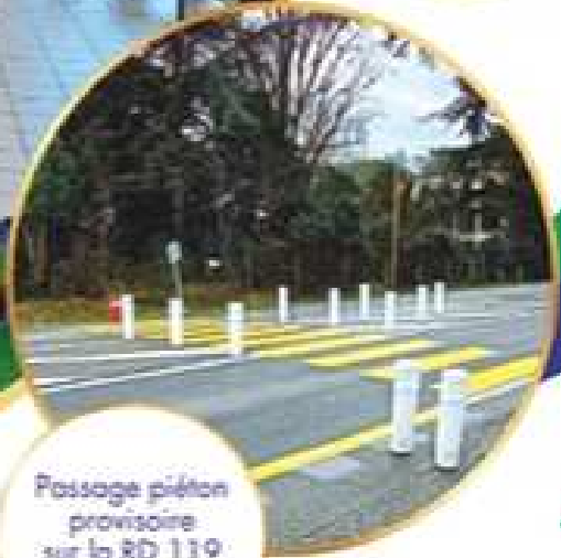
Passage piéton provisoire sur la RD 119 Pont de Lassalle