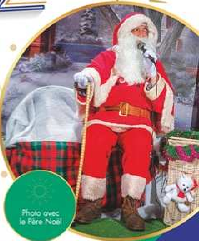
Photo avec le Père Noël